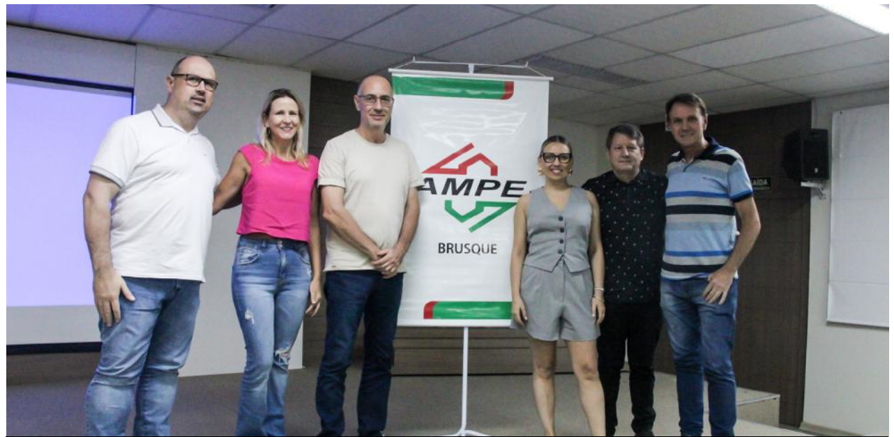
Os diretores da AmpeBr e integrantes do Núcleo Têxtil da entidade, com a palestrante do evento

Durante o evento, a especialista mostrou que é preciso entender o porquê das tendências, antes de aplicá-las em suas marcas. “As tendências vêm do comportamento. Então, primeiro precisamos compreender o que o consumidor está buscando, o que está acontecendo no mundo. Assim, iniciamos conhecendo e entendendo como esses fatores influenciam na moda para depois aprofundar e trazer formas, cartelas de cores, peças chaves e o que está em alta no mercado da moda”, explicou.