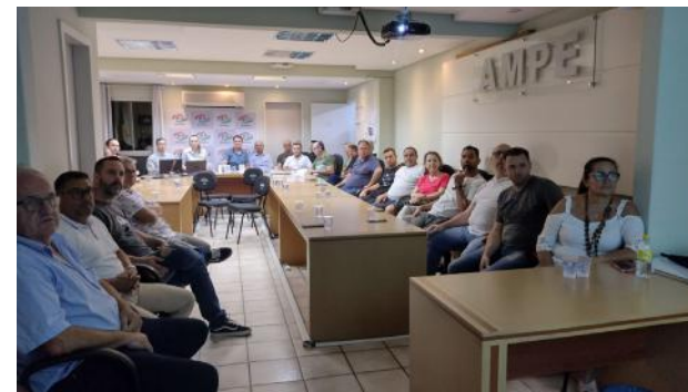
A reunião contou com a presença de integrantes da diretoria da entidade, além de associados, e da assessoria jurídica e contábil

Na oportunidade foi apresentado o relatório da gestão do exercício anterior (2023); a prestação de contas do mesmo período, com os pareceres dos Conselhos Fiscal e Deliberativo. Também esteve em pauta a autorização de venda do veículo Chevrolet Spin para efetivar a troca deste por outro veículo novo. “A prestação de contas é realizada para que nos-