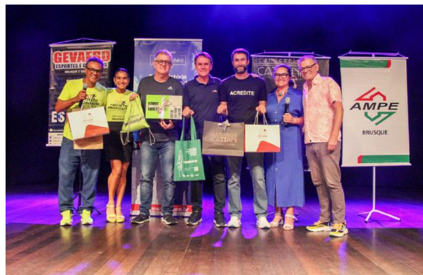
Além da AmpeBr, o Grupo Júlio Imóveis, Calçados Gevaerd e Camicerie Laura Cattani também foram organizadores do evento

Além da AmpeBr, o Grupo Júlio Imóveis, Calçados Gevaerd e Camicerie Laura Cattani também foram organizadores do evento.